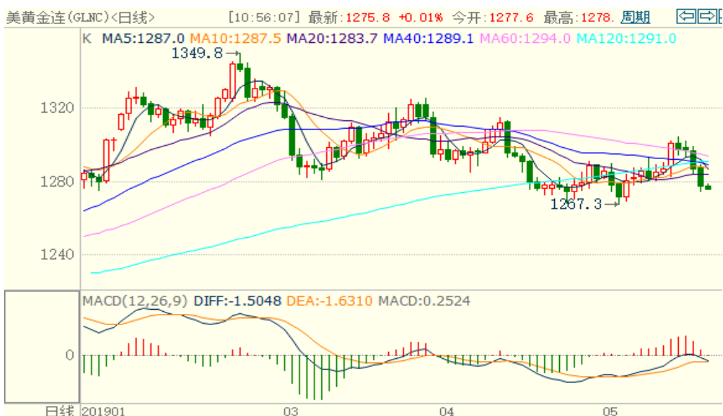
图 1：COMEX 黄金主力合约技术分析

COMEX 黄金技术指标偏空，预计本周或振荡下跌，建议逢高做空。国内人民币仍有贬值压力，预计国内黄金略偏强。